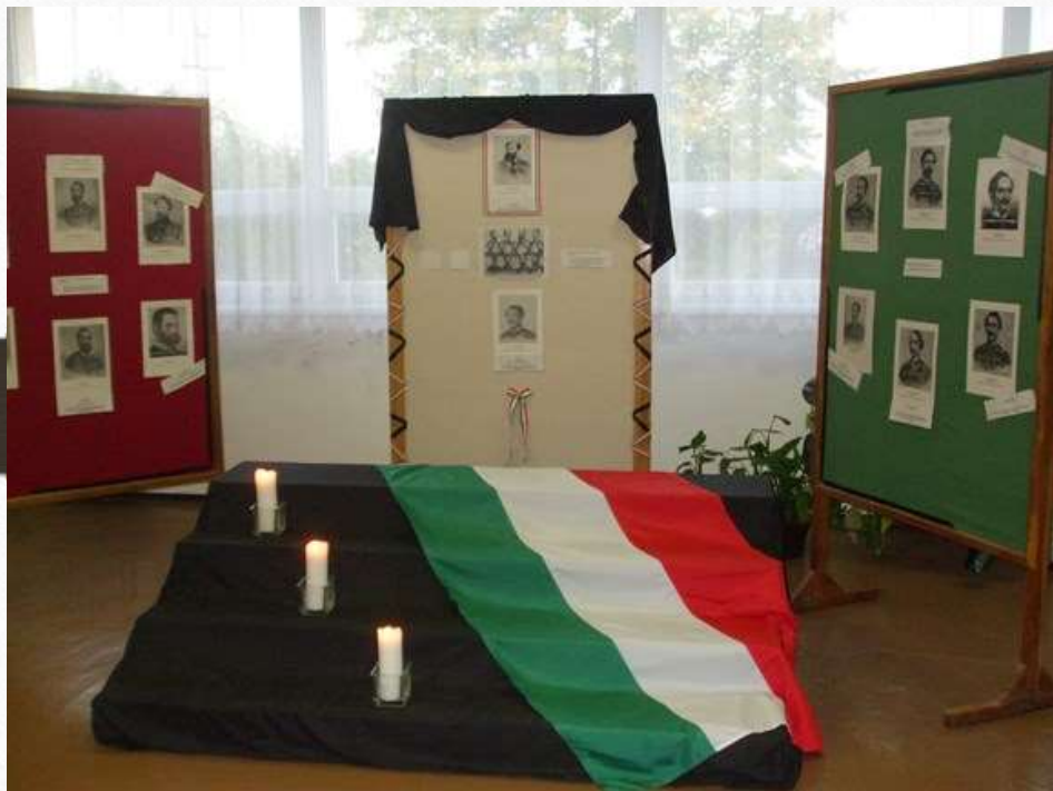
Megemlékezés az aradi hősökre – hagyományosan a humán tagozat 9. évfolyamának a feladata