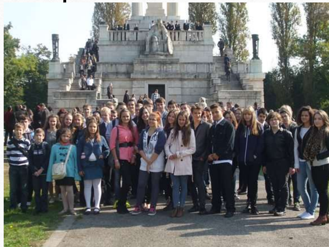
Látogatás és koszorúzás a Nemzeti sírkertben. A program keretében tanulóink hagyományosan leróják kegyeletüket iskolánk névadójának nyughelyénél.