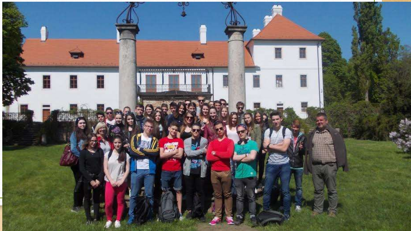
Kamalduli szerzetesek kolostoránál, Majkon