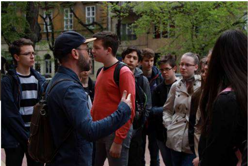
Holocaust emlékséta - Budapest