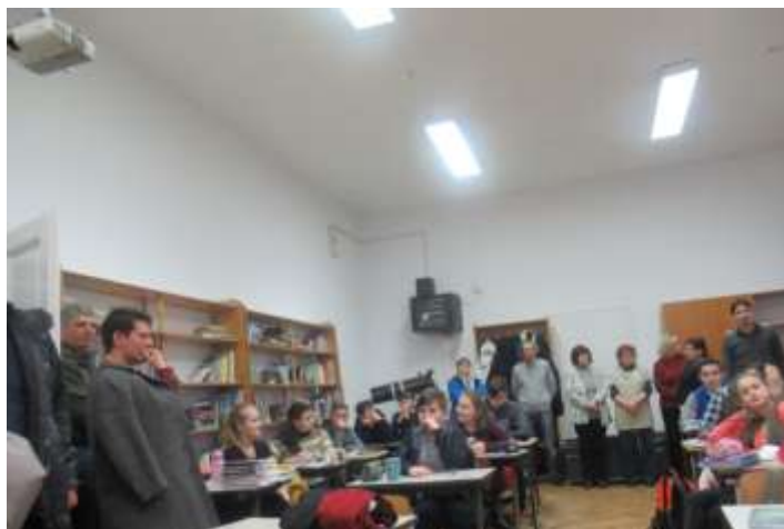
A 8. osztály terme, szilencium