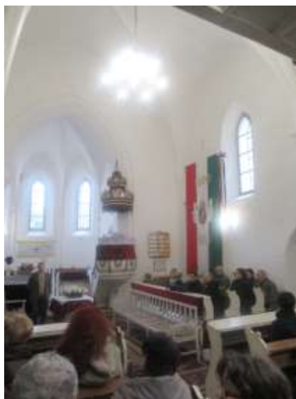
Református erődtemplomát a 13- 14. században építették, 1524-óta a reformátusoké.