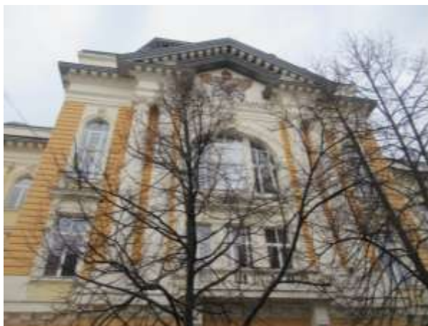
Egykori Királyi Törvényszék, ma a II. Rákóczi Ferenc Kárpátaljai Magyar Főiskola főépülete